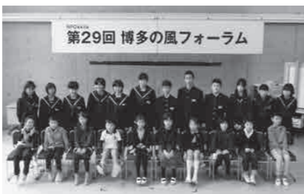
第12回入賞者 (平成25年11月)

今回で13回目となる楽文コンテストですが、7月から9月の期間に、福岡市内外の小中学生から、1500弱の応募がありました。11月16日(土)に博多小学校 表現の舞台で、優秀作品の表彰と、各賞代表の方の作品発表を予定しています。詳しくはホームページをご確認ください。